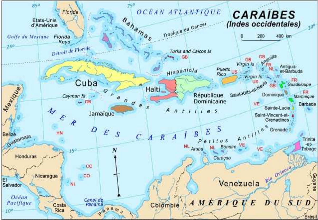
www.atlas.gc.ca © 2003. Sa Majesté la Reine du chef du Canada, Ressources naturelles Canada.

http://www.laguadeloupecaraibe.fr/spip.php?article30